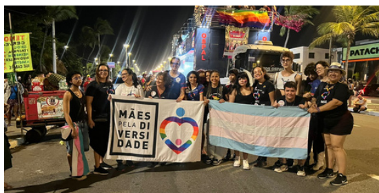
31 de agosto - 24 Parada LGBTQ+ de Sergipe | Aracaju, SE