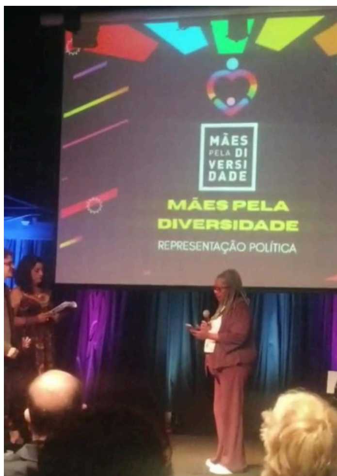
16 de outubro - Recebimento do Prêmio Janaína Lima por Representação Política | São Paulo, SP

Recebimento de honrarias em reconhecimento ao trabalho promovido para inclusão e em defesa dos Direitos Humanos.