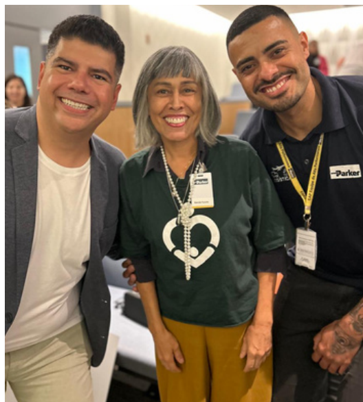
28 de agosto - Encontro de OSCs e a empresa Parker | São José dos Campos, SP