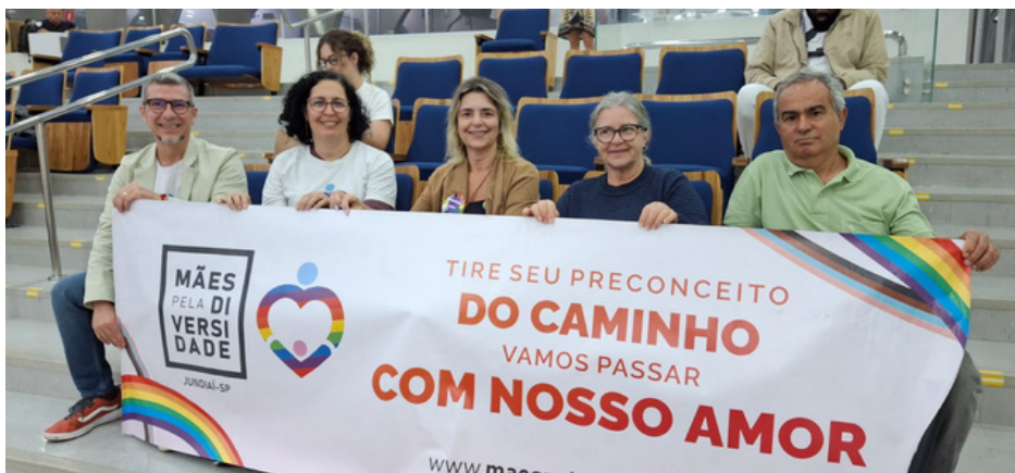
22 de setembro - Audiência pública do Projeto de Lei para proteção do envelhecer LGBT+ | Jundiaí, SP