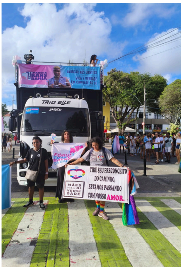
13 de setembro - 6ª Marcha Trans | Salvador, BA