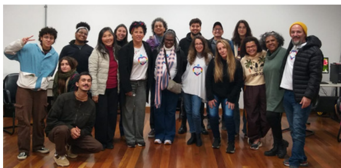
25 de junho - Roda de conversa com Mães pela Diversidade e UMAPAZ | São Paulo, SP