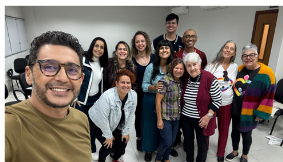
17 de maio - Roda de conversa sobre o livro Mães Fora do Armário | Brasília, DF