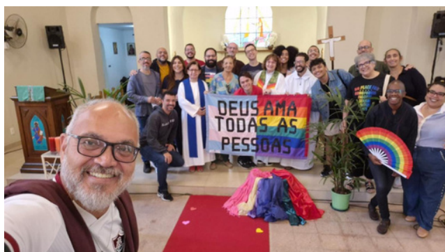
6 de julho - Culto do Orgulho na Igreja Anglicana do Méier | Rio de Janeiro, RJ