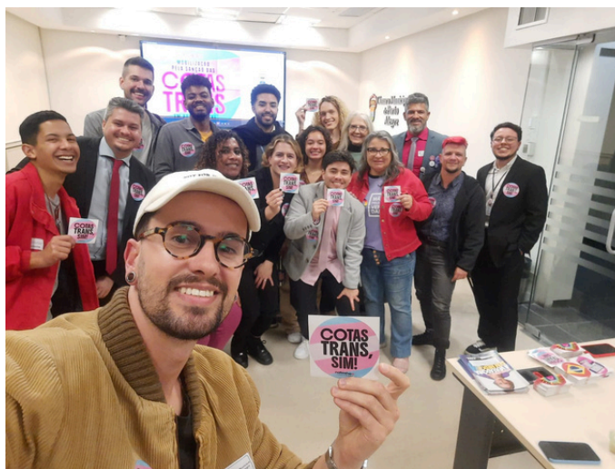
27 de agosto - Mobilização na Câmara de Vereadores para sancionar cotas trans em concursos públicos municipais | Porto Alegre, RS