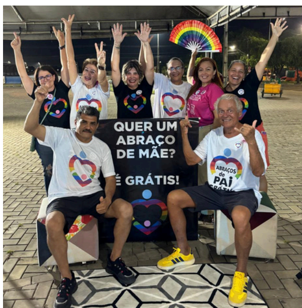
1 de novembro - Festival Cultural DiveRRsidade | Roraima, RR

Atuação em espaços acadêmicos, políticos e comunitários, como congressos, seminários, audiências públicas e mesas-redondas. Nessas ocasiões, representantes da ONG contribuíram com reflexões sobre acolhimento familiar, políticas públicas e cidadania LGBTQIA+, ampliando a visibilidade da pauta e fortalecendo o diálogo com gestores, pesquisadores e sociedade civil.