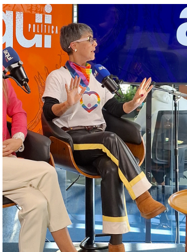
25 de junho - Entrevista no Aqui Vale: comemoração ao mês da visibilidade, no programa Aqui Política | São José dos Campos, SP