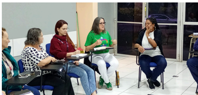
27 de maio - Roda de conversa do setor de responsabilidade social da Trensurb | Porto Alegre, RS