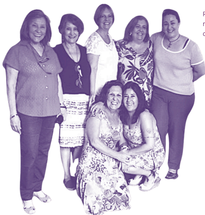
Reunião de mães fundadoras da OSC

Inicialmente estruturada como um espaço de escuta e apoio a familiares, a atuação das Mães se ampliou com núcleos organizados em diferentes regiões do país. Em novembro de 2017, foi oficialmente consolidada e celebrada como Organização da Sociedade Civil (OSC).