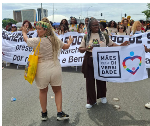
25 de novembro - Marcha das Mulheres Negras | Brasília, DF