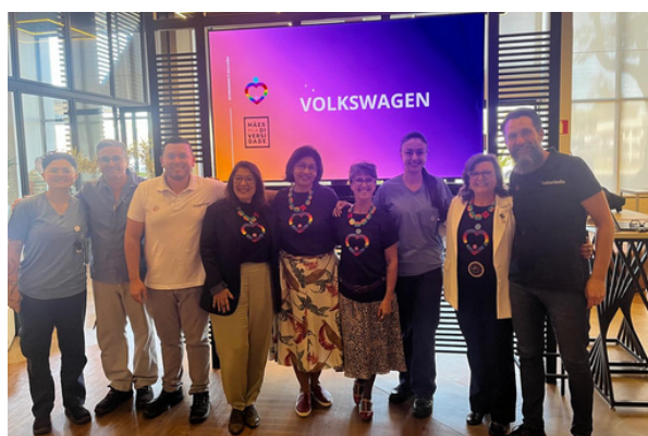
3 de setembro - Palestra na Volkswagen | São José dos Campos, SP