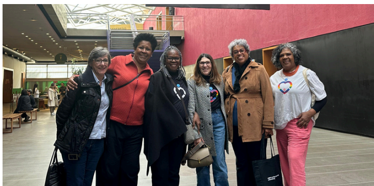
6 de julho - Visita ao Instituto Tomie Ohtake + Bloomberg | São Paulo, SP