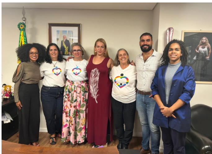
3 de junho - Reunião com a Secretaria Nacional dos Direitos das Pessoas LGBTQIA+ | Brasília, DF