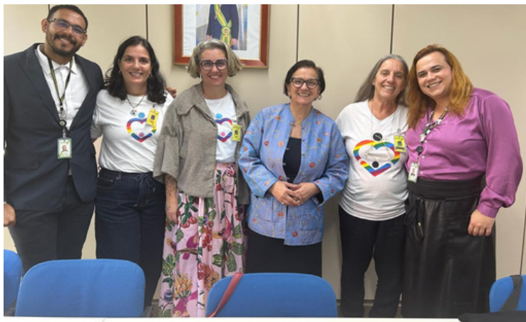
3 de junho - Reunião com a Secretaria Nacional de Diálogos Sociais | Brasília, DF