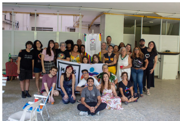
25 de maio - Encontro Mães pela Diversidade do Rio de Janeiro | Rio de Janeiro, RJ