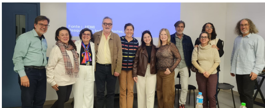
24 de setembro - Cine-debate em parceria com Aliança Francesa de São José dos Campos | São José dos Campos, SP

Atividades voltadas ao diálogo aberto com comunidades, estudantes, profissionais e movimentos sociais, abordando temas como saúde, educação, direitos e enfrentamento à violência.