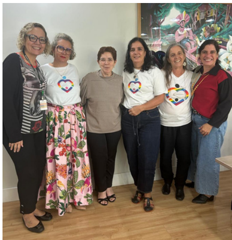
3 de junho - Reunião com a Chefia de Gabinete do Ministro da Saúde | Brasília, DF