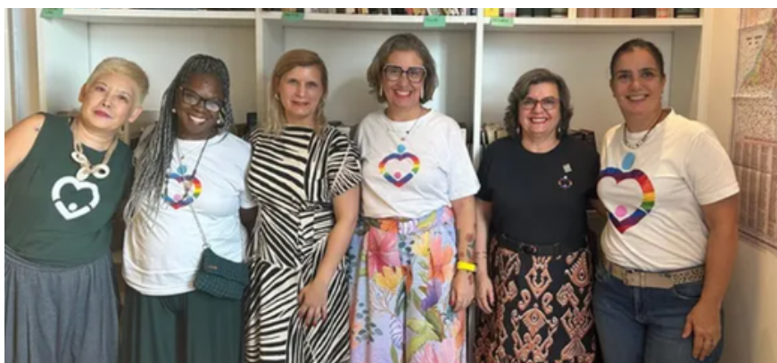
2 de abril - Reunião com a cônsul Marie Gelders no Consulado-Geral da Bélgica em São Paulo | São Paulo, SP

Incluem a participação em audiências públicas, reuniões com autoridades e articulação com outras entidades afins.