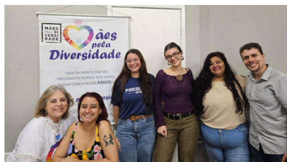
8 de julho - Grupo de apoio, suporte e escuta para familiares de pessoas LGBTQIA+ | Vitória - ES