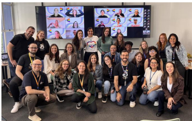
22 de junho - Roda de conversa sobre parentalidade afetiva e amplificação do amor na General Mills | São Bernardo do Campo, SP

Palestras e rodas de conversa voltadas aos colaboradores do segundo setor.