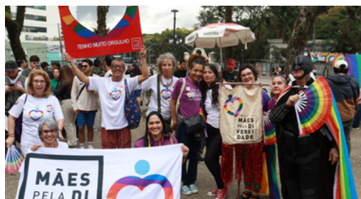
29 de junho - Marcha pela Diversidade | Curitiba, PR