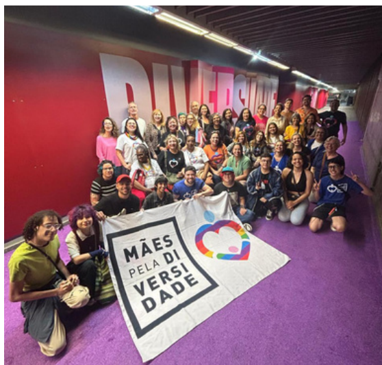
18 de maio - Confraternização de Dia das Mães no Museu da Diversidade Sexual de São Paulo | São Paulo, SP

Reuniões virtuais e presenciais, dedicadas à escuta ativa, apoio emocional e troca de experiências entre mães acolhedoras, mães, pais e familiares, proporcionando um espaço seguro de compreensão, fortalecimento e afeto.