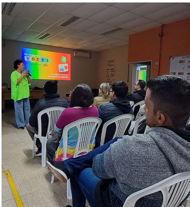
3 de julho - Palestra na unidade da UPL Brasil | Salto de Pirapora, SP

Palestras e rodas de conversa voltadas aos colaboradores do segundo setor.