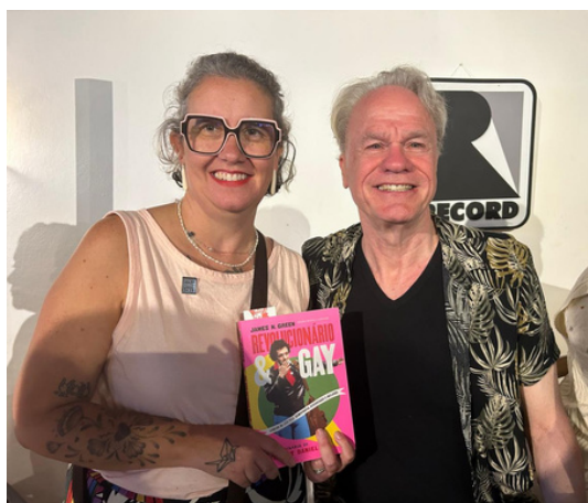
30 de julho a 3 de agosto - FLIP 2025 | Paraty, RJ