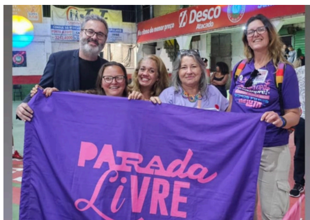
14 de setembro - Parada Livre da Restinga | Porto Alegre, RS