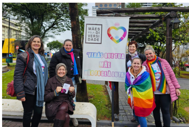
29 de junho - Parada LGBTQ+ | Chapecó, SC