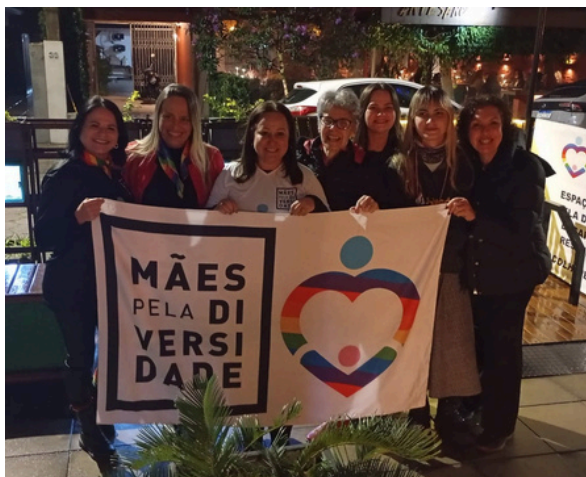
26 de agosto - Inauguração da sede das Mães pela Diversidade | Florianópolis, SC