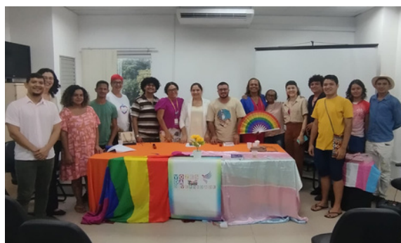
26 de junho - II Seminário de Diversidade Sexual e de Gênero da UFOPA | Santarém, PA