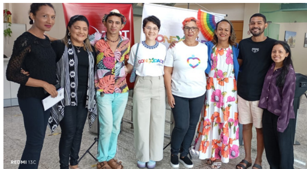
3 de setembro - Feirão de Empregabilidade LGBTQIAPN+ | Santarém, PA