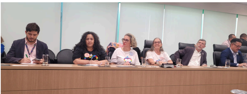
24 de julho - Mães com o Ministro da Saúde e outras organizações do Movimento Social LGBTQIA+ | Brasília, DF