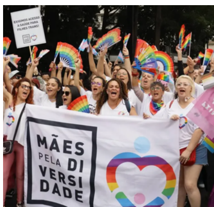
22 de junho - 29ª Parada do Orgulho LGBTQ+ de São Paulo | São Paulo, SP

Participações em atos públicos de visibilidade, celebração e reivindicação dos direitos da população LGBTQIA+ em diversas capitais e cidades do interior. Em quase todas as Paradas, as Mães são convidadas a estar à frente do desfile como uma maneira de "abrir as asas para proteger as filhas, filhos e filhos".